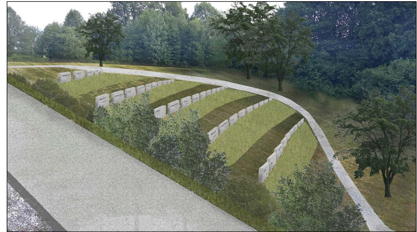
pogled na terasirano brežino za klasični pokop