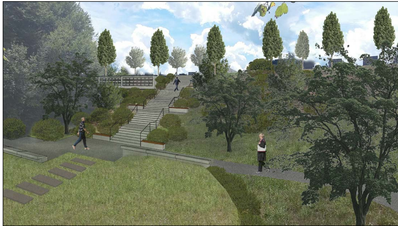
pogled na spodnjo ploščad, stopnišče in kolumbarij