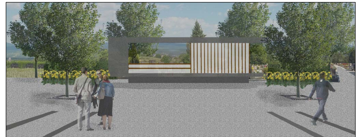
zgornja ploščad s paviljonom